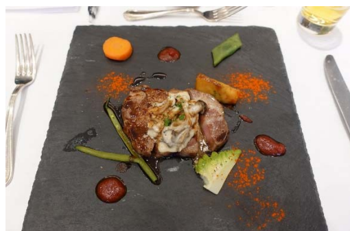
肉：豚肩ロースときのこのア・ラ・クレーム りんごのキャラメリゼソース・ヴァン・ルージュ