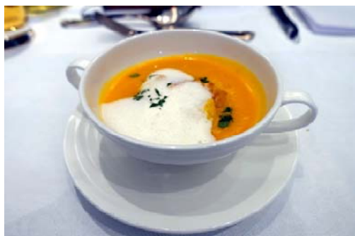
濃厚でコクのある人参のポタージュ パンとオリーブオイル