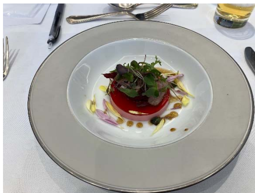
彩り豊かなビーツのムースとA5ランク和牛もも肉のミ・キュイのサラダ仕立て