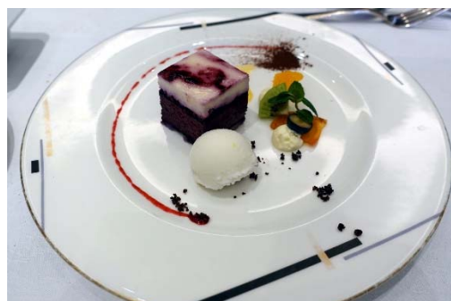
パティシエの気まぐれスイーツ 他にコーヒー・紅茶