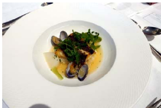
魚：天然真鯛とアサリのプレゼ 白菜とベーコンのエテュベ