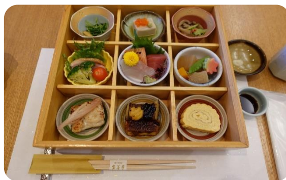
季節の「旬小鉢」に舌鼓！！