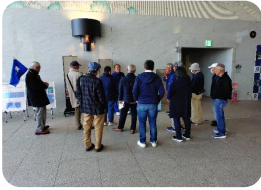
ホールで「ろ過」の説明