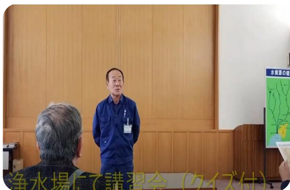
まずはレクチャー そしてクイズ・・・