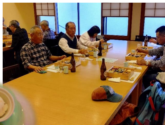
デザートもあるですよ～