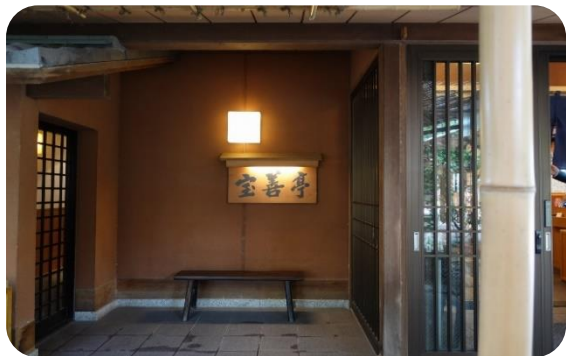
この時期、予約の取りづらい園内の人気店