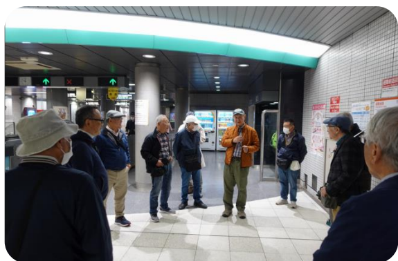
駅の改札口に集合