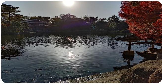
伊勢湾を模した龍仙湖