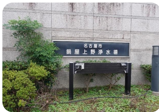
徒歩5分ほどで浄水場到着