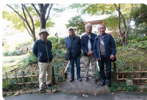
一万歩もなんのその！