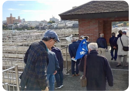
「凝集沈でん池」高低差を使い SDG s