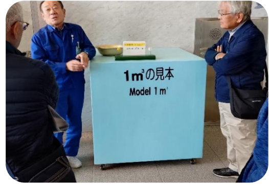
水道水の安全・安心・安価の話