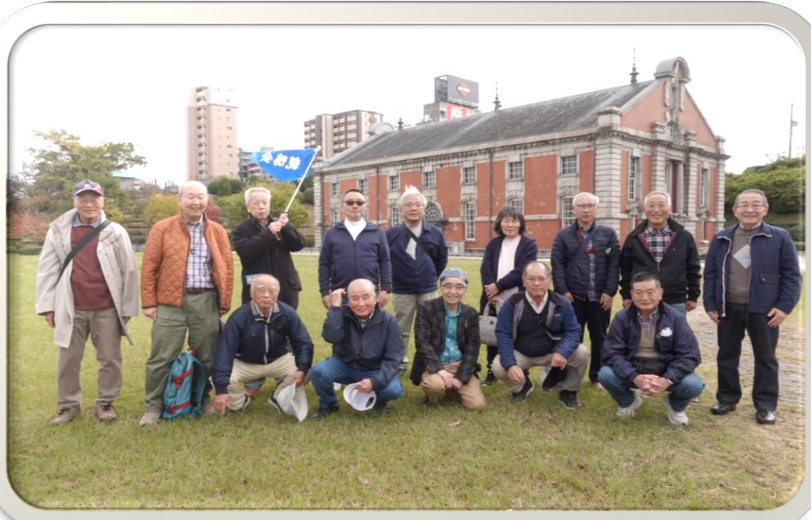
旧第一ポンプ所前で集合写真