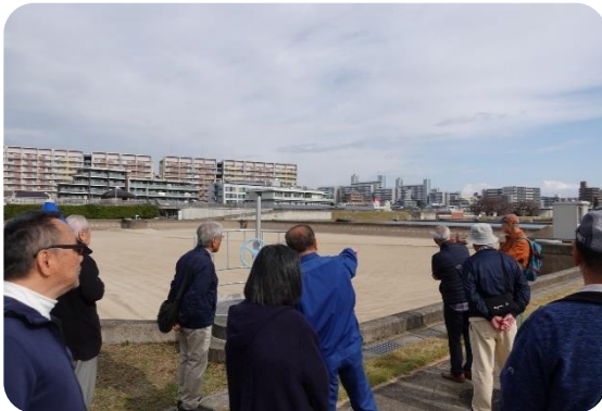
「暖速ろ過池」約 15 時間かけてろ過