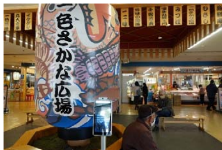
一色さかな広場で買物 コロナのせいで試食が少なかったのが残念