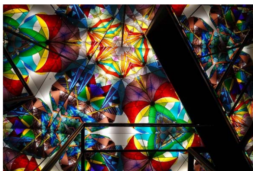
三河工芸ガラス美術館 の巨大万華鏡