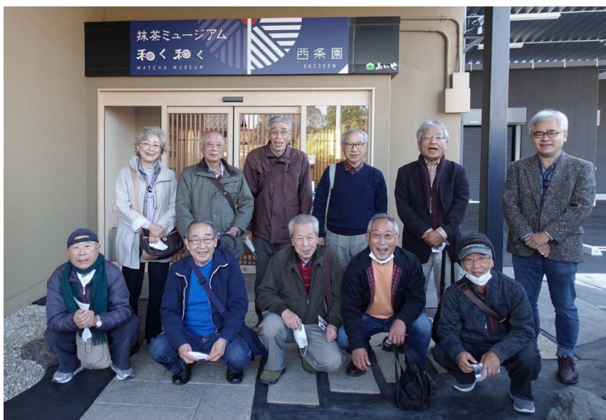
西条園抹茶ミュージアム和く和くにて